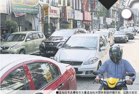
孟加拉专员署吸引大量孟加拉外劳来到安邦镇大街，以致大街交通非常繁忙。