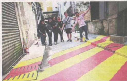
A dreary back lane of Kuala Lumpur being changed for the better by volunteers with just cans of paint.