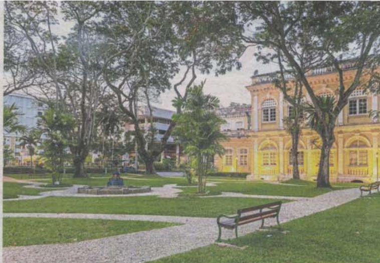
George Town's restored Fountain Garden is now a prime attraction, proving that old can be gold.

In this book, Gehl makes the argument on why the creation or recreation of cityscapes must be done on a human scale so that cities can truly be human-centric, rather than car-centric as is the case in numerous countries including Malaysia.