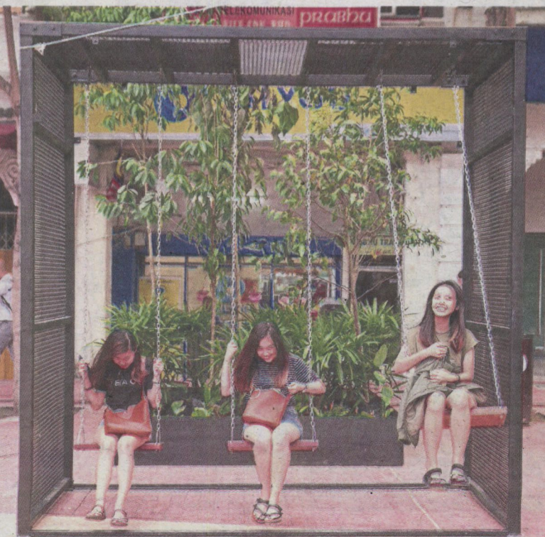
The addition of a seemingly simple contraption such as swings can lend a simple and understated appeal to a place like Medan Pasar, Kuala Lumpur.

The contemporary definition of placemaking: "it is a multifaceted approach to the planning, design and management of public spaces that capitalise on a local community's assets, inspiration and potential,