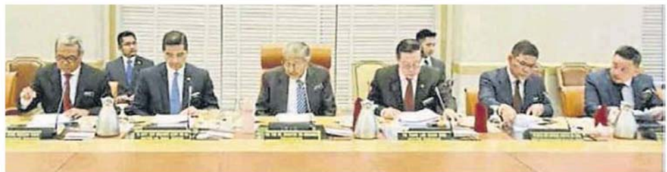
■马哈迪(右4)主持第6次经济行动理事会会议。右起为达勒雷京、赛夫丁纳苏迪安、林冠英、阿兹敏及莫哈末里祖安。

出席会议的部长包括财政部长林冠英、经济事务部长拿督斯里阿兹敏阿里、国内贸易及消费人事务部拿督斯里赛夫丁纳苏迪安、国际贸易及工业部长达勒雷京及企业发展部长拿督斯里莫哈末里祖安。