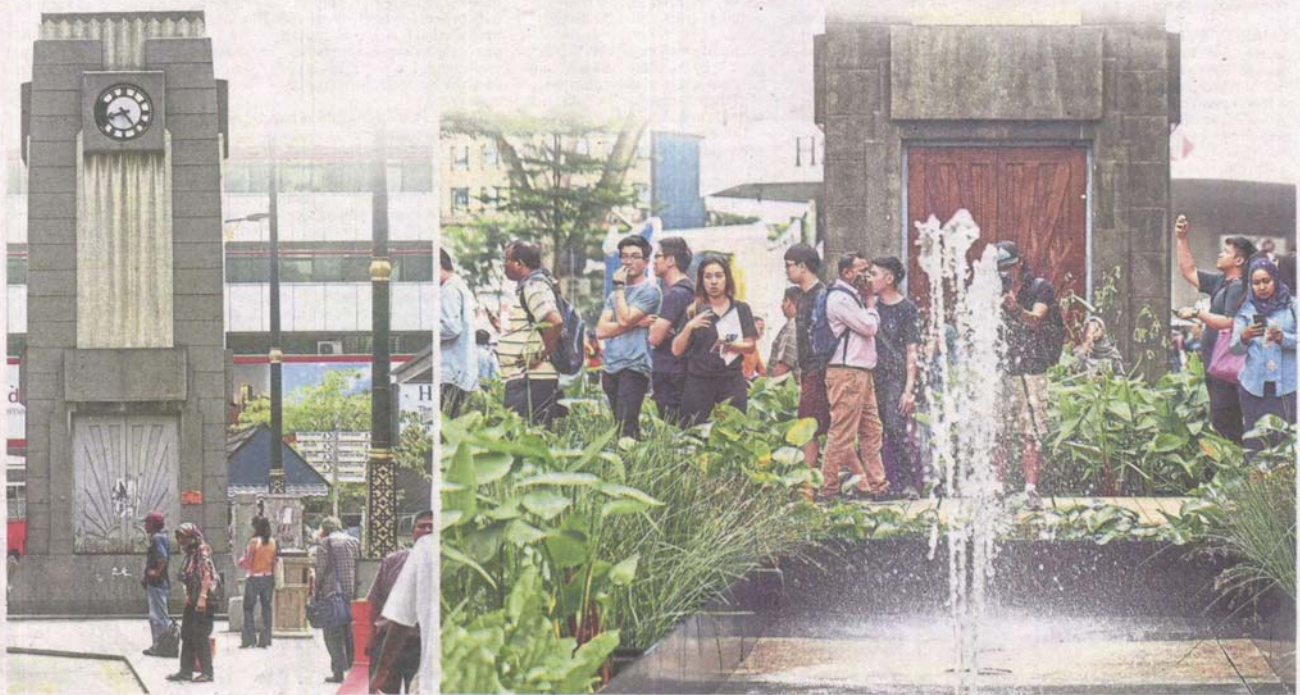
Transformative step: A little placemaking effort can transform the concrete-jungle-and-exhaust-fume-choked Medan Pasar into a green respite complete with a mini fountain.

Making urban spaces liveable takes more thought than it has been given. The good news is local authorities in the Klang Valley are taking steps towards that end, but anyone with concerted effort can make improvements to their surroundings where they live or work. >2&3