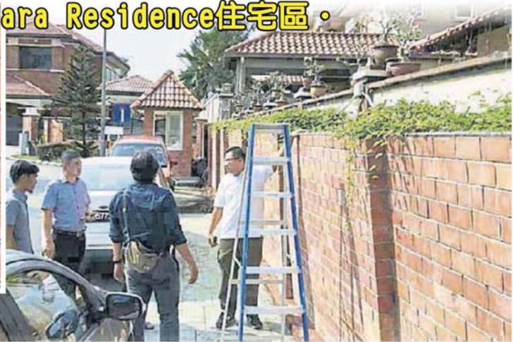
■ 市议会官员爬上围墙了解围墙后的状况。