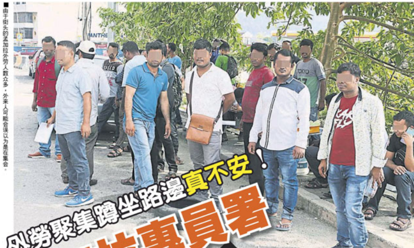
由于街头的孟加拉外劳人数众多，外来工聚集区以是聚集地。

Provided for client's internal research purposes only. May not be further copied, distributed, sold or published in any form without the prior consent of the copyright owner.