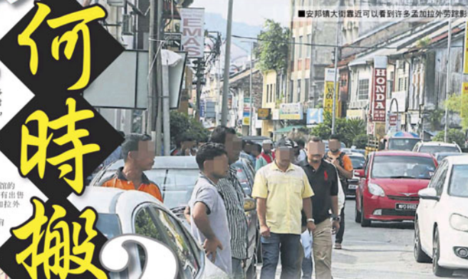
安邦镇大街最近可以看到许多孟加拉外劳踪影。

有些孟加拉外劳坐在五脚基路旁，有些数个人围起来谈话，他们虽然成群结队聚集在路边，但是没有吵闹喧哗，也没有混找路过的人。