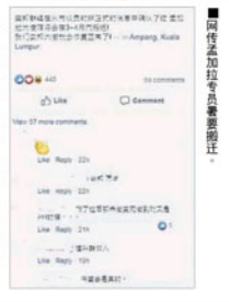
网传孟加拉专员署会搬迁。