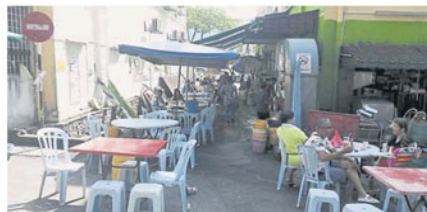
斯嘉城早市前面店屋的食肆把桌椅摆在横巷。