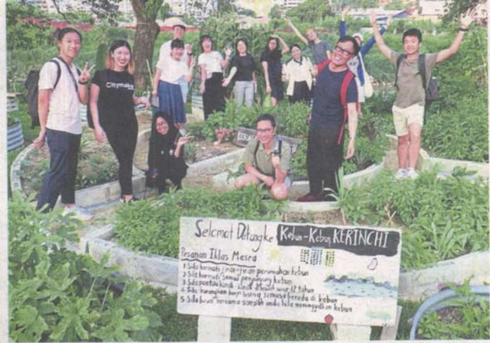
Kampung Kerinchi residents joined hands with other placemakers to create Kebun-Kebun Kerinchi in March, out of a strip of land along Sungai Klang, and positively transformed the landscape (right).