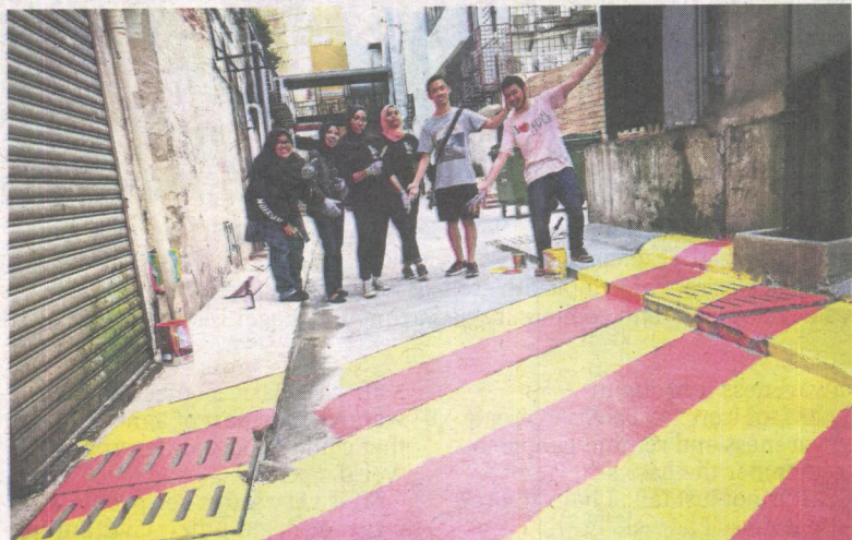
A dreary back lane of Kuala Lumpur being changed for the better by volunteers with just cans of paint.