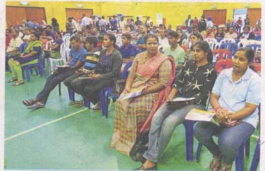
Around 100 people attended the Sitham briefing programme in Bandar Puteri Puchong organised by MPSJ.