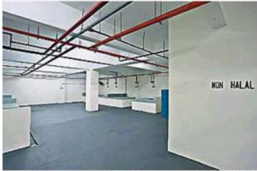
非清真區設在角落處，缺乏鐵架、風扇設施，小販擔心環境悶熱，有著自行掏腰包安裝風扇。