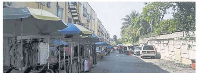
避免阳光暴晒，早市于上午 11 时 30 分就收档。

“我们在一些街道安装了闭路电视后，民众不敢再丢垃圾，反而把垃圾丢在没闭路电视的地方。”