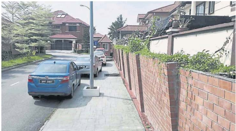
居协称这幅围墙 5 年前开始倾斜。

兴建工程，市议会将发出通令，在违例兴建条款下，可面对最高 2 万 5000 令吉罚款。