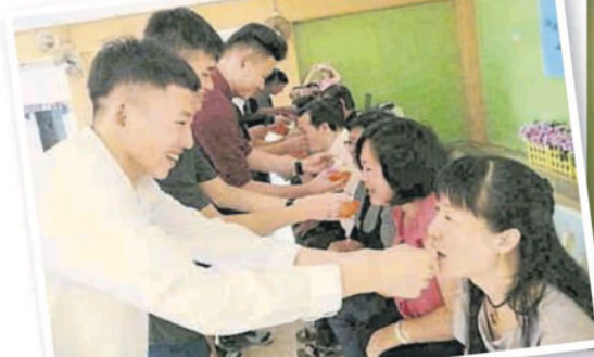
■ 学生喂汤圆给老师家长，可谓吃在嘴里甜在心里。