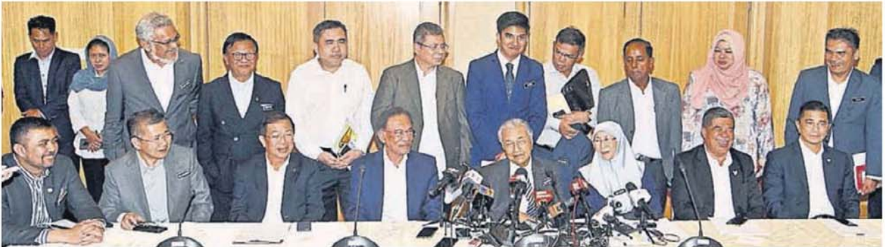
■馬哈迪（坐者左5）主持希盟最高中央理事會會議後，向媒體發表談話；左起為馬祖基、沙拉胡丁阿育、陳國偉、安華、旺阿茲莎、莫哈末沙布和阿茲敏阿里。

馬哈迪說，雖然政治委任常遭受非議，但政府仍會在必要時，通過政治委任給那些沒有官職，但又辛勤工作的領袖一個職位。