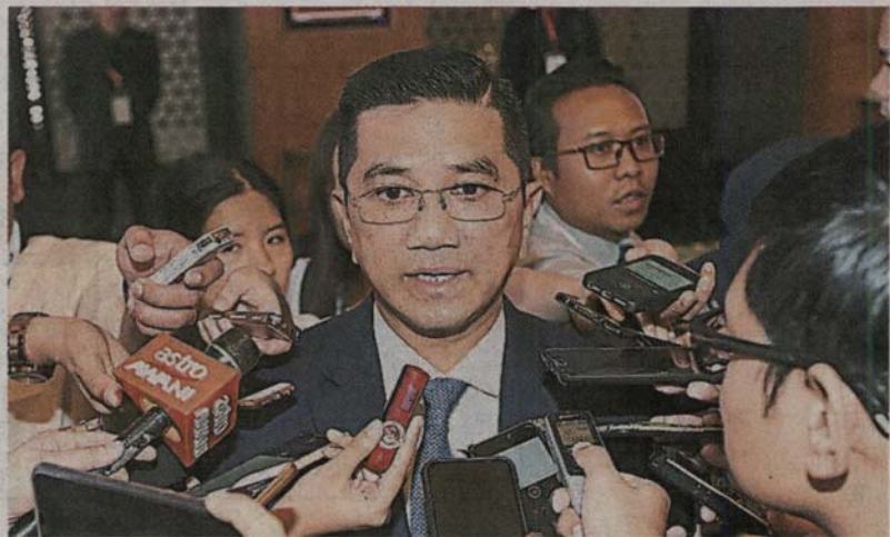
■阿兹敏阿里说，在过去10年，国库控股出售了超过100项总值约650亿令吉的资产。

(吉隆坡7日讯) 经济事务部长拿督斯里阿兹敏阿里表示，政府尚在研究收购马航的献议书，并证实有超过一家公司提出收购的献议，惟他无法披露太多详情，而且他并非适当的发言人。一旦有所决定，国库控股与马航将会宣布。