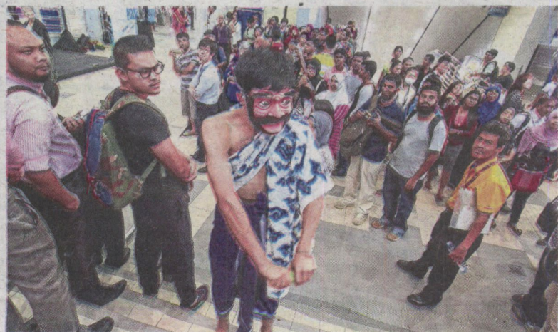
Placemaking may also include arts, whether installations or performances, as part of its appeal, such as this Butoh dance by the Nyoba Kan group at Masjid Jamek LRT station in Kuala Lumpur as part of Arts on the Move, a joint initiative between Think City and Prasarana Malaysia.