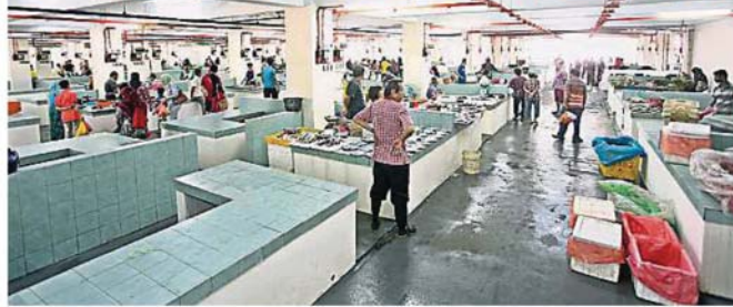
底層的濕巴剎設有約150個檔口，尚有許多小販還未遷入。

《大都會》社區記者今早走訪新巴剎時，發現新巴剎的294個檔口中，大部分都空蕩蕩、閉門深鎖。