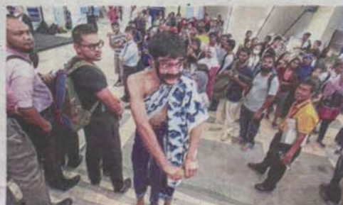
Placemaking may also include arts, whether installations or performances, as part of its appeal, such as this Butoh dance by the Nyoba Kan group at Masjid Jamek LRT station in Kuala Lumpur as part of Arts on the Move, a joint initiative between Think City and Prasarana Malaysia.