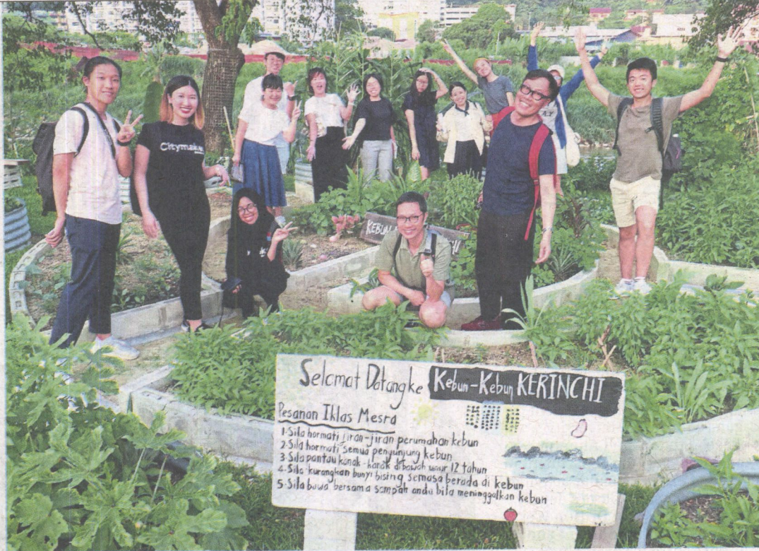
Kampung Kerinchi residents joined hands with other placemakers to create Kebun-Kebun Kerinchi in March, out of a strip of land along Sungai Klang, and positively transformed the landscape (right).