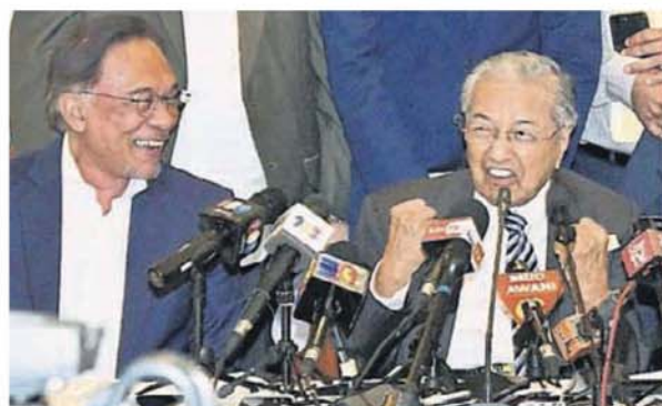
■馬哈迪（右）打趣地擺出要「打架」的姿勢，左為安華。