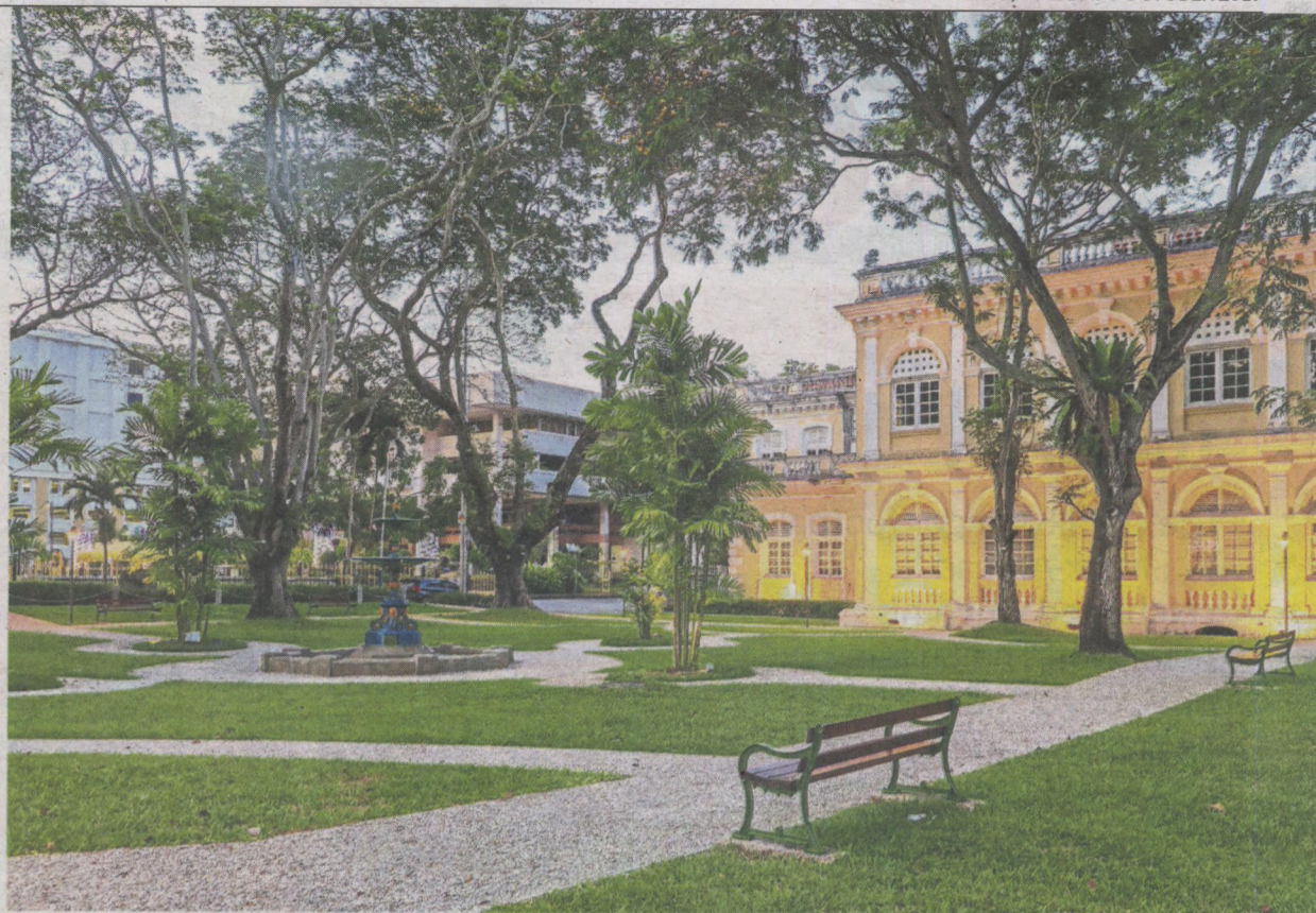
George Town's restored Fountain Garden is now a prime attraction, proving that old can be gold.

In this book, Gehl makes the argument on why the creation or recreation of cityscapes must be done on a human scale so that cities can truly be human-centric, rather than car-centric as is the case in numerous countries including Malaysia.