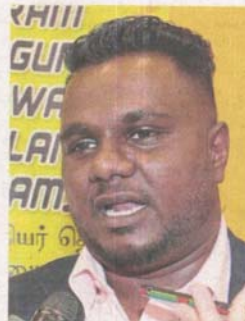
Thiban says the programme gives priority to Indians as part of efforts to get them out of poverty.

Aside from MPSJ, briefing sessions for the programme was also held at other councils including Ampang Jaya and Shah Alam.