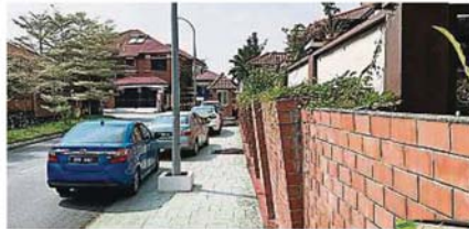
100呎的圍牆，疑受到毗連花約一雙溪龍鎮第二區長約的傾斜龜裂。