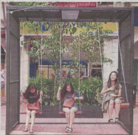
The addition of a seemingly simple contraption such as swings can lend a simple and understated appeal to a place like Medan Pasar, Kuala Lumpur.

The contemporary definition of placemaking: "it is a multifaceted approach to the planning, design and management of public spaces that capitalise on a local community's assets, inspiration and potential,